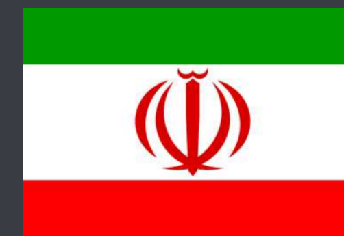
Исламская Республика Иран