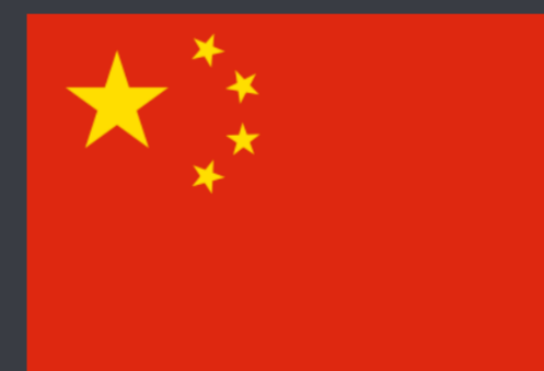
Китайская Народная Республика